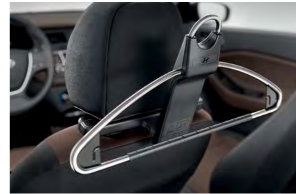
Vješalica za odijela. Neka vaša odjeća bude uredno odložena i bez nabora tijekom putovanja. Lako i sigurno se montira na prednje sjedalo i lako ju je skinuti kada ju želite koristiti drugdje. Ispunjava sigurnosne zahtjeve za prisutne putnike.