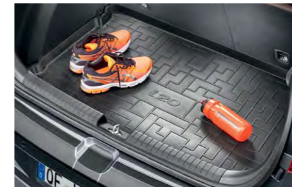
Zaštita za prtljažnik. Lagana, vodootporna i trajna zaštita za prtljažnik s povišenim rubovima štiti dno prtljažnika od blata, prolijevanja i prljavštine. Savršen spoj uz dodatak i20 logotipa.