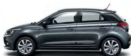
Star Dust metalik