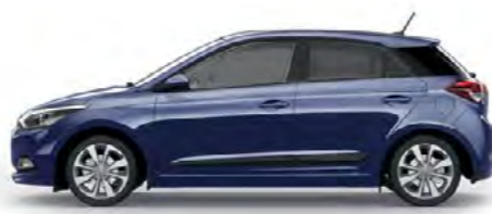
Morning Glory metalik