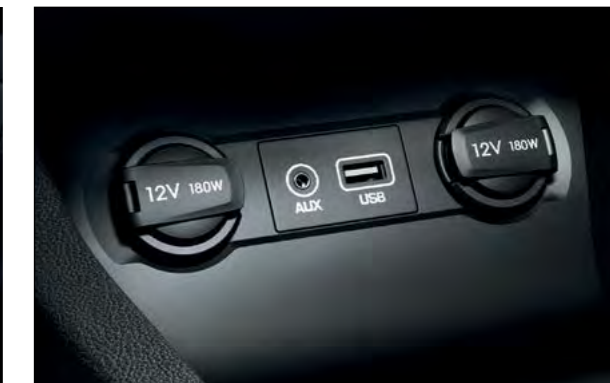
Aux i USB ulazi. Lako povezivanje za vaš pametni telefon ili MP3 uređaj. Samo uključite i uživajte.