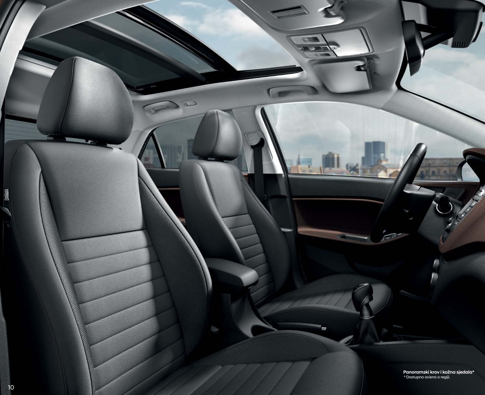
Panoramski krov i kožna sjedala* * Dostupno ovisno o regiji.