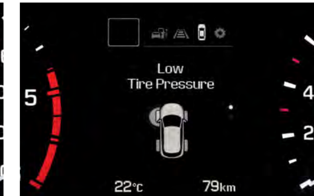
Sustav nadzora tlaka u gumama. Detektira i grafički na ekranu putnog računala prikazuje gubitak tlaka u gumama, posebno ističući o kojoj se gumi radi.