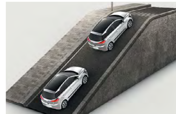
Sustav pomoći pri pokretanju na uzbrdici.** Sprječava nenamjerno kretanje unatrag tijekom pokretanja vozila uzbrdo.