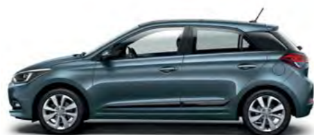
Aqua Sparkling metalik