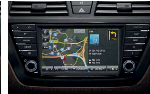
Integrirani navigacijski sustav.* Navigacijski sustav lak za upotrebu s impresivnim 7" zaslonom neprimjetno integriranim u kontrolnu ploču.