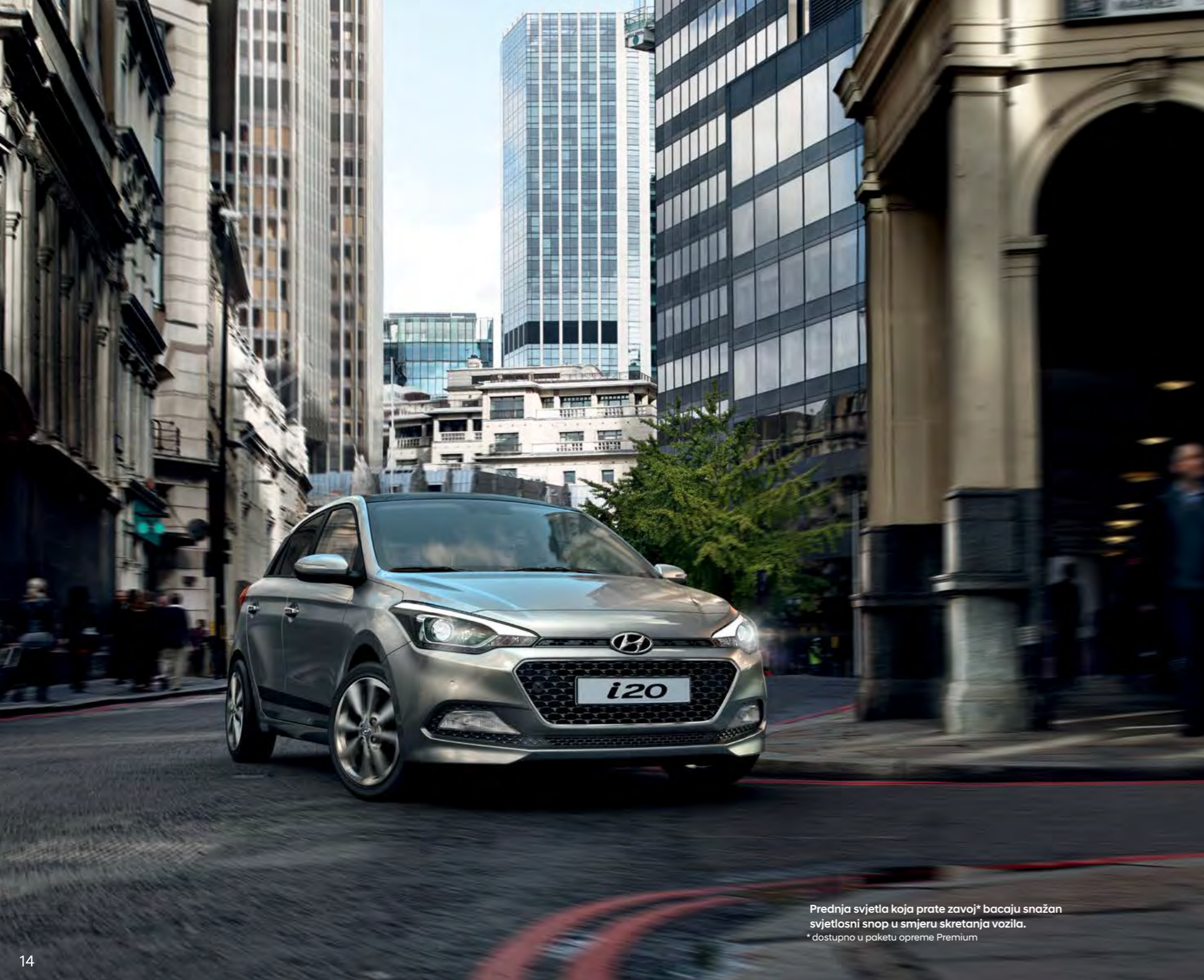
Prednja svjetla koja prate zavoj* bacaju snažan svjetlosni snop u smjeru skretanja vozila. * dostupno u paketu opreme Premium