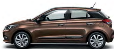
Cashmere brown metalik