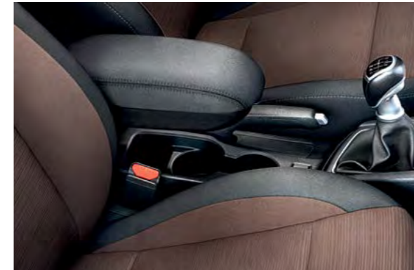
Naslon za ruke s pretincem za odlaganje. Stilski i udoban naslon za ruke povećava udobnost položaja tijela tijekom vožnje te ima dodatni korisni prostor za odlaganje.