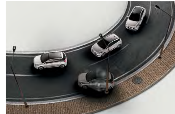
Elektronski nadzor stabilnosti vozila radi nenametljivo sa sustavom za upravljanje stabilnosti vozila kako bi se održala kontrola nad vozilom i prijanjanje cesti, posebice na klizavim površinama.

A strastveni smo i po pitanju uvođenja više sigurnosti u ovaj tržišni segment, tako da šasija i struktura karoserije koriste čelike iznimno velike čvrstoće. Pored senzora za kišu* i automatskih svjetala*, novi i20 nudi i profinjena svjetla koja prate zavoj*, sustav upozorenja o napuštanju vozne trake* i sustav nadzora tlaka u gumama.