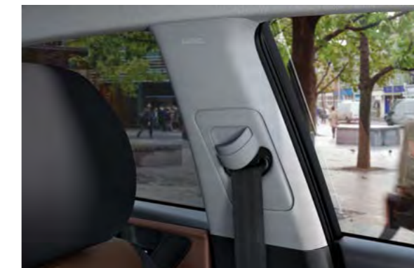
Sigurnosni pojasevi podesivi po visini. Nosači gornjih prednjih sigurnosnih pojaseva podesivi su po visini za još više sigurnosti i veću udobnost.