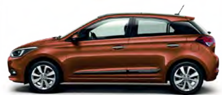
Tangerine Orange metalik