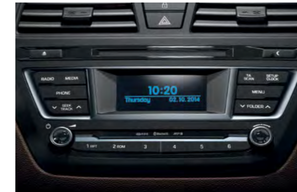
Audio sustav. RDS radio s CD/MP3 playerom te Bluetooth povezivanjem i 1GB memorije. Sustavom se može upravljati i putem kontrola na upravljaču. Bluetooth marka je vlasništvo Bluetooth SIG In