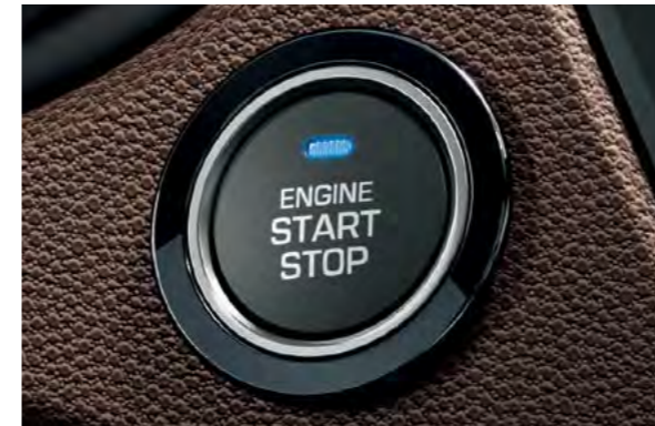
Start/stop tipka motora. Pokretanje bez ključa kada je pametni ključ u vozilu u vašem džepu ili torbi.

Kompletna unutrašnjost je izrađena od pažljivo odabrane tkanine i materijala koji će vas impresionirati svojom savršenom prikladnošću i velikom kvalitetom. Dobiveni ambijent u kombinaciji s raznom opremom čini i20 jedinstvenim u svojoj klasi. Istaknute značajke uključuju kožu, stanicu za punjenje pametnih telefona na gornjem dijelu ploče s instrumentima i 7" navigacijski sustav s integriranom kamerom za vožnju unatrag. Značajke mogu biti standardne ili opcijske, ovisno o modelu.