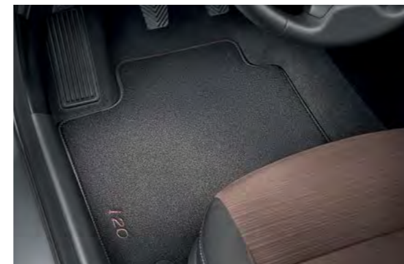
Tekstilni tepisi, velur sa smeđim detaljima. Luksuzni velurni tepisi sa smeđim šavovima i i20 logotipom. Osigurani standardnim točkama za pričvršćivanje i protukliznom poledinom. Dostupno i u sivoj, plavosivoj i bež boji.