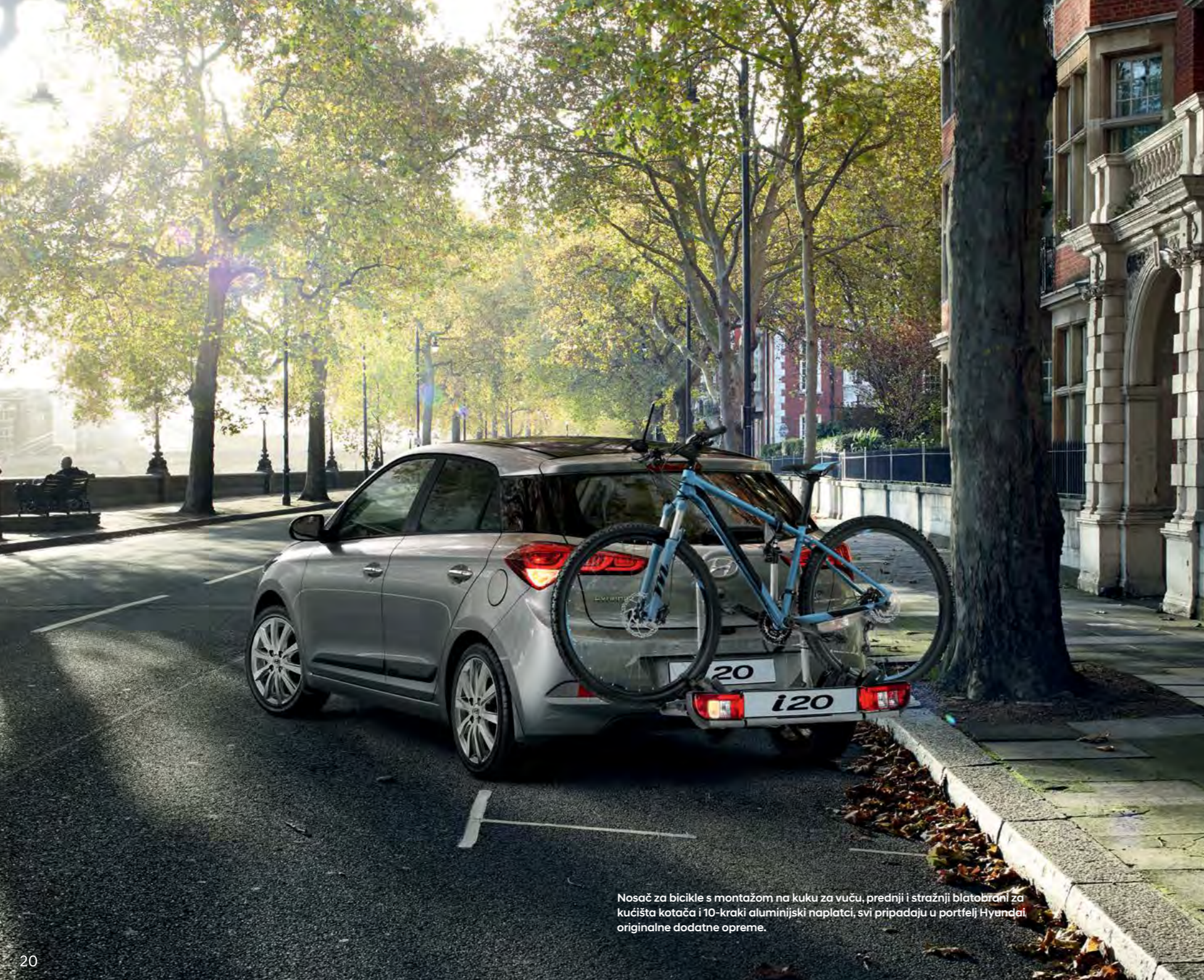
Nosač za bicikle s montažom na kuku za vuču, prednji i stražnji blatobrani za kućišta kotača i 10-kraki aluminijski naplatci, svi pripadaju u portfelj Hyundai originalne dodatne opreme.