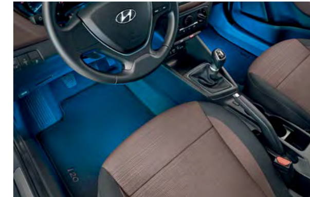
Plavo LED osvjetljenje prostora za noge. Skriveno podno osvjetljenje koje vam poželi dobrodošlicu automatskim uključivanjem i isključivanjem prilikom otvaranja i zatvaranja prednjih vrata.