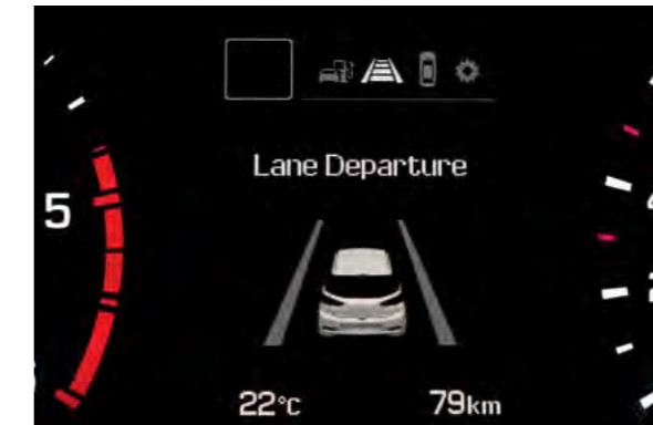
Sustav upozorenja o napuštanju vozne trake.* Prvo vizualno, a zatim zvučno upozorenje u slučaju napuštanja vozne trake.