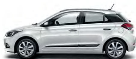
Polar White solid