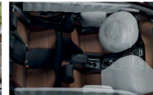
6 zračnih jastuka. Sveobuhvatna zaštita s 2 prednja zračna jastuka, 2 bočna zračna jastuka i 2 zračne zavjese.