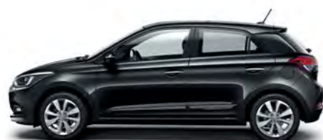
Phantom Black biserni efekt

Pri odabiru vam može pomoći vaš ovlaštenu Hyundai partner.