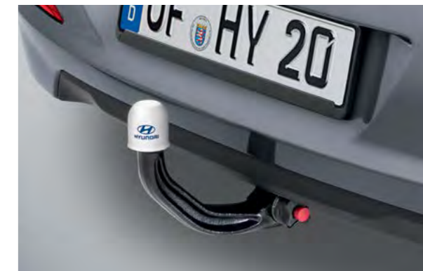
Kuka za vuču, okomita i skidiva. Od čelika visoke kvalitete sa sustavom zaključavanja u 3-točke za laku i sigurnu montažu. Skrivena od pogleda kad se ne koristi. Maksimalna bruto korisna nosivost za nosač za bicikle je 75 kg.