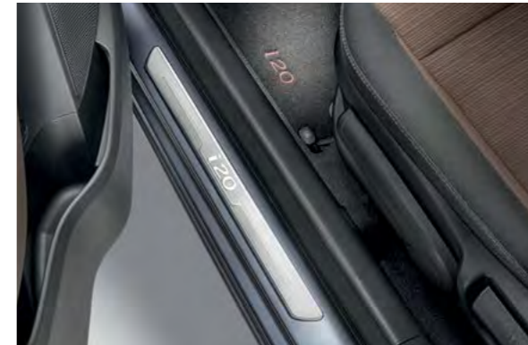
Zaštita pragova. Ova kvalitetna aluminijska zaštita pragova s i20 logotipom savršeno pristaje uz pragove i daje dodatni premium utisak svaki put kad otvorite vrata.