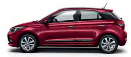
Red Passion biserni efekt