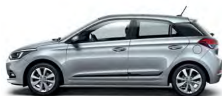
Sleek Silver metalik