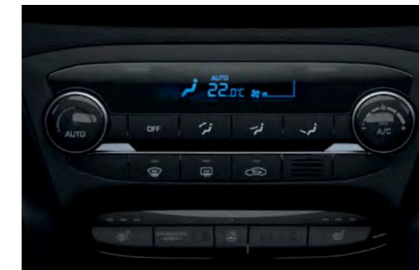
Automatska klimatizacija.*** Samo odaberite željenu temperaturu i sustav će učiniti ostalo. Postoji i funkcija automatskog odmagljivanja kako bi prozori ostali bistri.